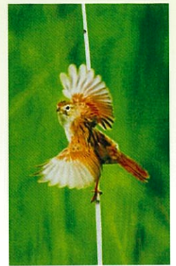
オオセッカ