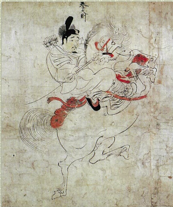
隨身庭騎絵巻(秦久則)

以前に、貴族社会の馬の集配・分配システムの中心にいた藤原道長は、大の「馬好き」で、自分のあげた馬の顔は何年後に見てもわかると話したことがあるが、その彼は大の競馬好きでもあり、長保元年(九九九)二月には、それまで16町であった自邸・土御門第(邸)に南一町を加えて、新しく馬場及び馬場殿を新造し、この年の五月八日には、翌日に「陸奥国交易馬御馬御覽」の儀式を控えた前日に、その土御門第の南門から交易御馬を牽き入れて、その馬場において彼自身が、天皇より先に交易馬を見分けていたのである…。それでは、次回も引き続き、道長・競馬・下毛野氏について話して行きたい。乞う、ご期待…。