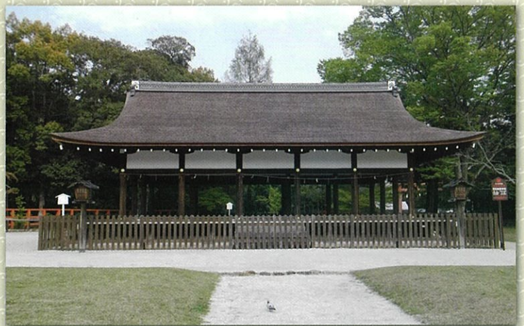
世界遺産 上賀茂神社「競馬」馬場殿