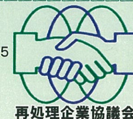
再処理企業協議会

2019年(平成31年)03月29日発行 再処理企業協議会 広報部会 〒039-3212 青森県上北郡六ヶ所村大字尾駸字弥栄平1-5 再処理企業センターB棟 TEL (0175)71-2487 FAX (0175)71-2488 URL https://www.saisyori-kigyokyogikai.jp/