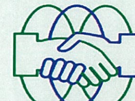
再処理企業協議会

URL https://www.saisyori-kigyokogyokai.jp/