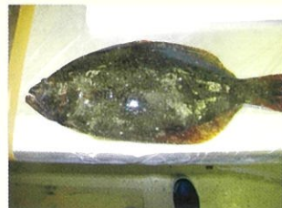
こんなに大きいヒラメも灰にして分析します。