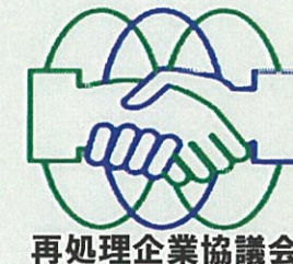
再処理企業協議会

URL https://www.saisyori-kigyokogyokai.jp/