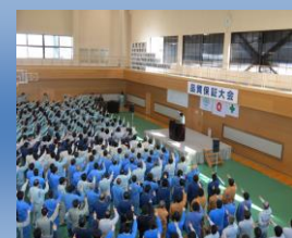
品質保証大会の様子