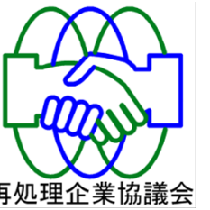
再処理企業協議会

2014年(平成26年)5月26日発行 再処理企業協議会 広報部会 〒039-3212 青森県上北郡六ヶ所村大字尾駈字弥栄平 1-5 再処理企業センターB棟 TEL (0175) 71-2487 FAX (0175) 71-2488 URL https://www.saisyori-kigyogyokai.jp/