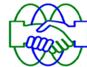
再処理企業協議会

2014年(平成26年)9月30日発行 再処理企業協議会 広報部会 〒039-3212 青森県上北郡六ヶ所村大字尾駁字弥栄平1-5 再処理企業センターB棟 TEL(0175)71-2487 FAX(0175)71-2488 URL https://www.saisyori-kigyokyogikai.jp/